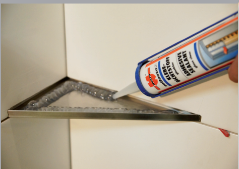
Fliese oder Glas mit Neutralsilikon bzw. Spezialkleber anbringen