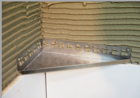
Festkleben der Ablage