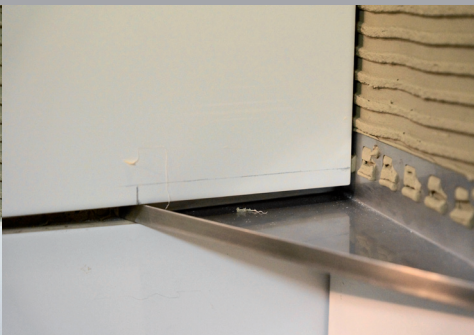
Fliese anzeichnen und ausklinken