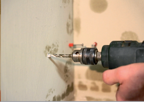
Bohren und Setzen der Dübel