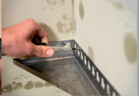
Festschrauben der Ablage